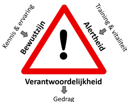
Figuur 1: De urgentiedriehoek